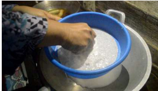
Gambar 4: Memasukkan santan ke dalam kualiti yang dipanaskan secara perlahan.