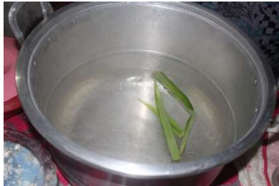
Gambar 11: Masukkan daun pandan ke dalam air.