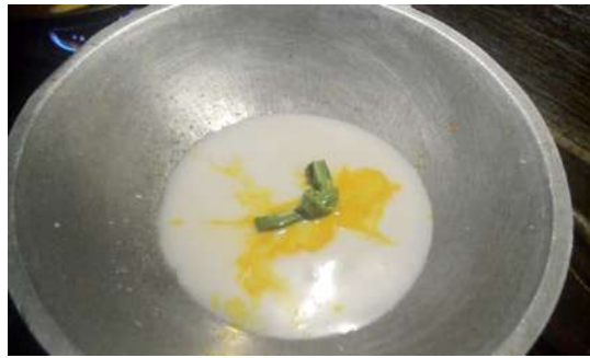
Gambar 6: Memasukkan daun pandan ke dalam santan yang sedang dipanaskan secara perlahan.