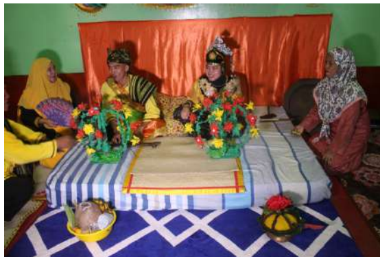
Gambar 1: Adat bebantang masyarakat Tidung di Kg Mentadak Baru, Pulau Sebatik.

Idea yang dibawa oleh Wijaya adalah seiring dengan pendapat Norhuda Salleh (2017), iaitu peranan pulut kuning yang menandakan simbol ikatan kekeluargaan yang kuat dengan mempertimbangkan sifat pulut kuning yang melekat(melekit). Sementara itu, dalam pelaksanaan adat bebantang ini pengantin juga perlu minum air putih bagi kedua-dua pasangan. Tujuan air ini dihidangkan dan perlu diminum adalah diharapkan kehidupan pasangan ini akan sejuk seperti mana sejuknya air putih yang diminum tersebut. Perkara ini secara tidak langsung membuktikan bahawa masyarakat Tidung turut mengaplikasikan makna sesuatu hidangan yang dihidangkan namun di dalam kertas kerja ini dapatan yang difokuskan hanya kepada hidangan pulut kuning sahaja.