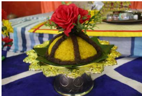
Gambar 17: Pulut kuning.

Kelapa manis atau disebut sebagai antin-antin dalam Bahasa Tidung bermaksud hiasan yang dibentuk di sekeliling pulut kuning. Hiasan ini dibentuk memanjang ke bawah dan terdiri daripada lima garisan dari atas ke bawah.