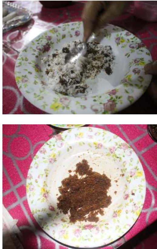
Gambar 16: Gaulkan bahan yang dicampurkan sehingga rata.