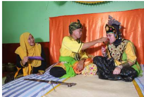
Gambar 3: Adat bebantang – pengantin lelaki memberi minum air kepada pengantin perempuan.