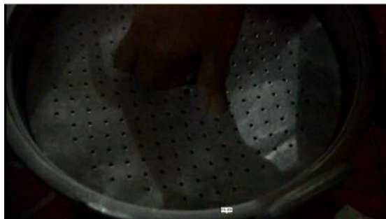
Gambar 12: Masukkan tapis pengukus.