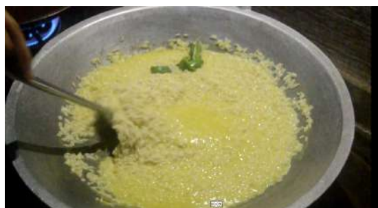
Gambar 9: Kacaukan bahan-bahan yang telah dimasukkan sehingga kering.