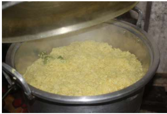
Gambar 13: Masukkan campuran beras pulut kuning yang telah dikeringkan ke dalam pengukus dan sedia untuk dikukus.