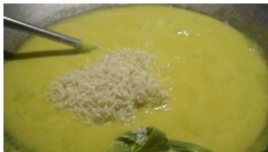
Gambar 8: Memasukkan beras ke dalam kuali..