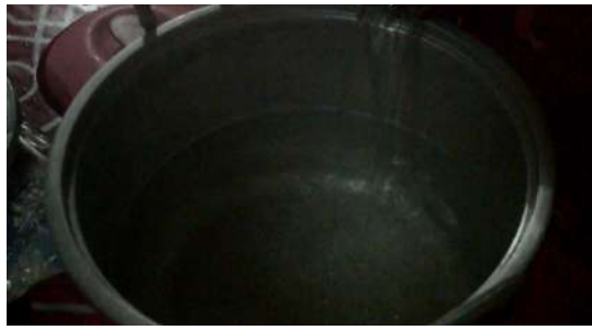
Gambar 10: Sediakan periuk dan masukkan air yang panas.