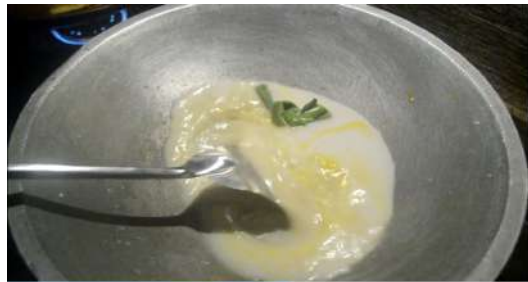
Gambar 7: Kacaukan bahan yang telah dimasukkan ke dalam kuali. Sumber: kajian lapangan Julai 2019.