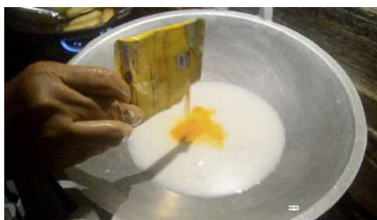
Gambar 5: Memasukkan kunyit ke dalam santan yang sedang dipanaskan secara perlahan.