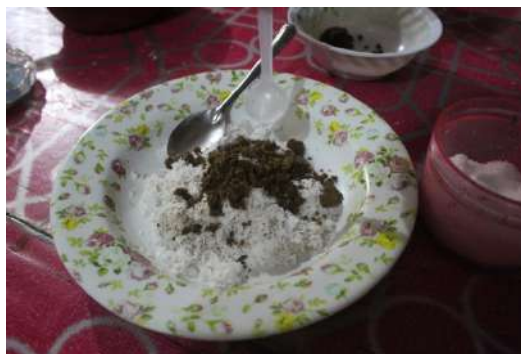
Gambar 15: Masukkan sedikit garam.