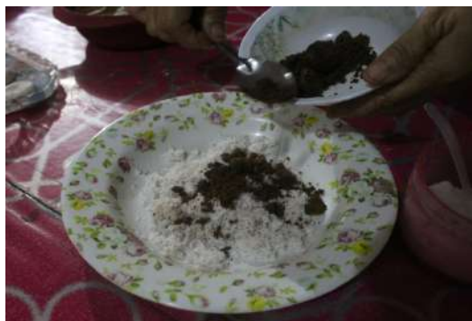
Gambar 14: Campurkan gula melaka ke dalam kelapa yang telah diparut. Sumber: kajian lapangan Julai 2019