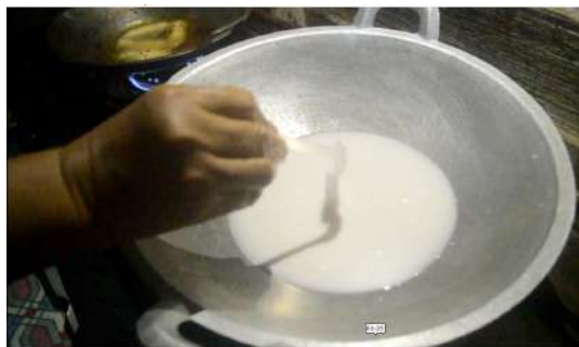
Gambar 4: Memasukkan garam ke dalam santan yang sedang dipanaskan secara perlahan.