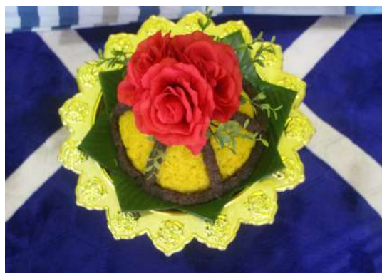
Gambar 16: Pulut kuning.

Terdapat enam elemen(sifat) yang menjadi penentu kepada tanda yang dimaknakan dari sudut qualisign mengikut pengamalan masyarakat Tidung dalam hidangan pulut kuning bagi adat bebantang. Ia terdiri daripada sifatnya, warna, rasa, motif, dan hiasan.