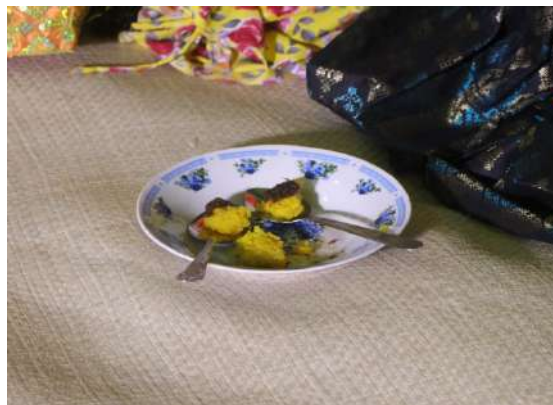
Gambar 2: Potongan pulut kuning yang dihidangkan dalam adat perkahwinan masyarakat Tidung.